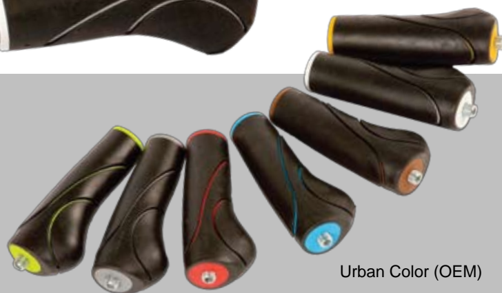
Urban Color (OEM)