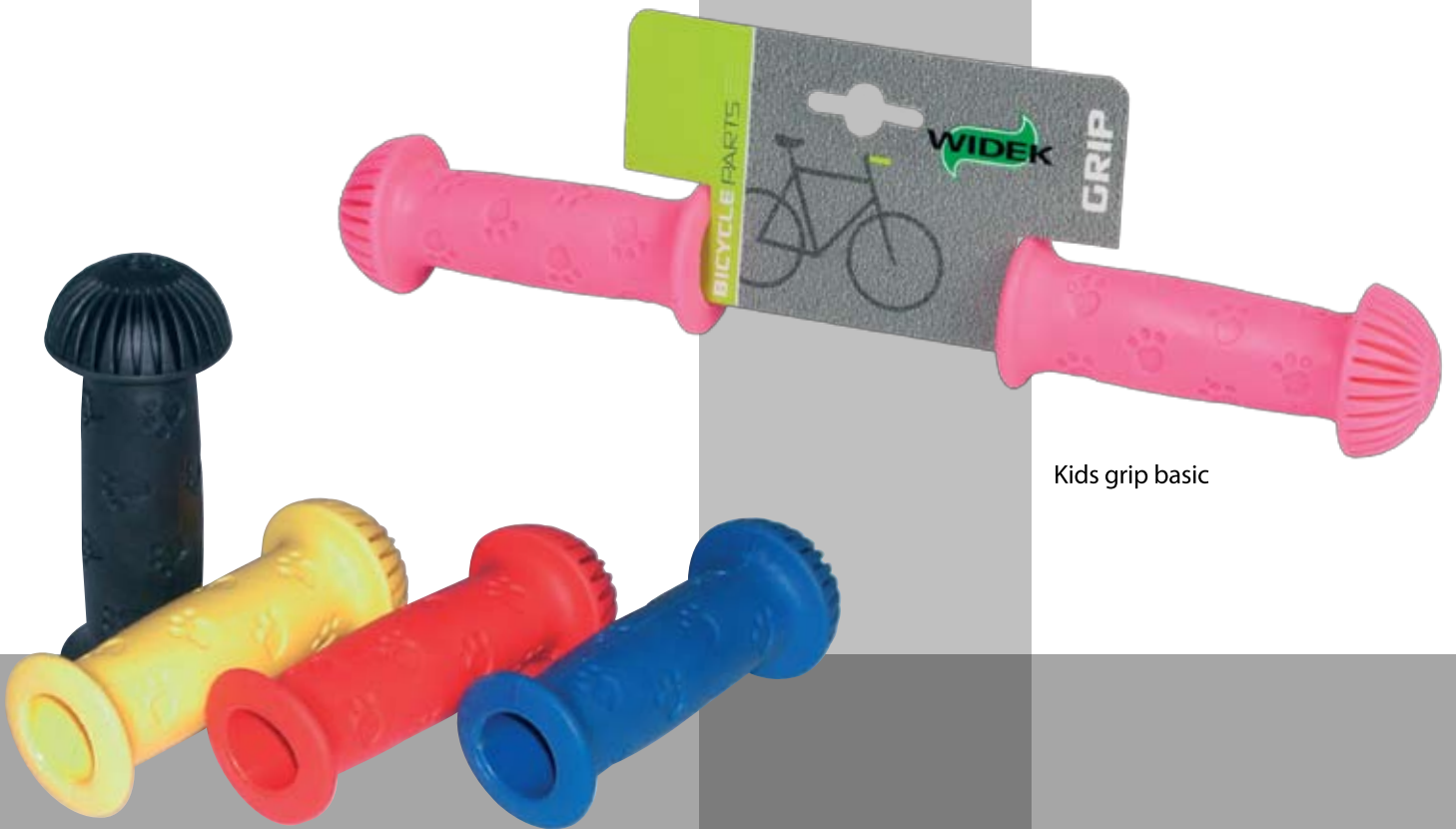
Kids grip basic