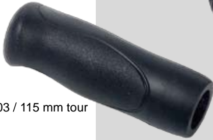
Grip Ergoline 103 / 115 mm tour